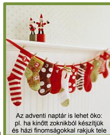
Az adventi naptár is lehet öko: pl. ha kinőtt zokniból készítjük és házi finomságokkal rakjuk tele